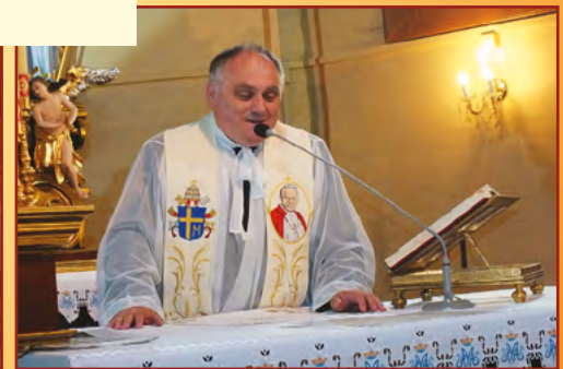
Pielgrzymka na Jasną Górę